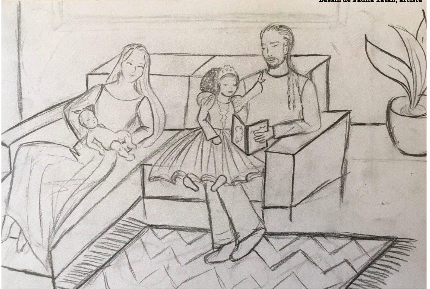
Dessin de Fadila Tatab, artiste